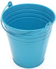
4 de emmer