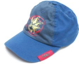
12 de pet