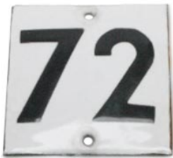
7 het huisnummer