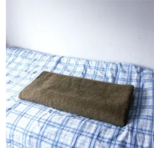
3 de deken