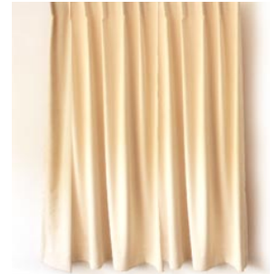
6 het gordijn