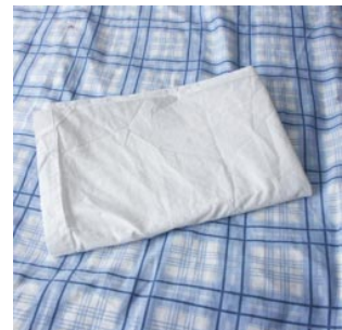
9 het laken