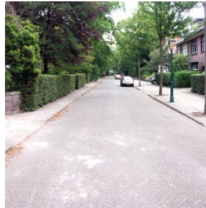
14 de straat