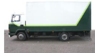
15 de vrachtwagen