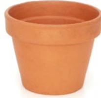
2 de bloempot