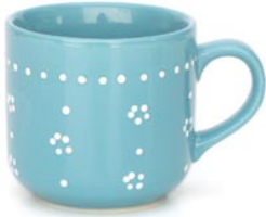
1 de beker