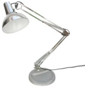
10 de lamp