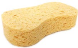
13 de spons