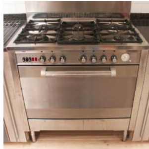
5 het fornuis