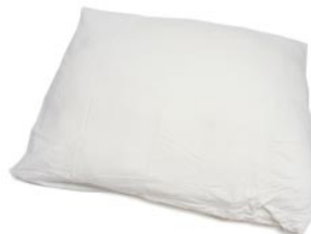
8 het kussen