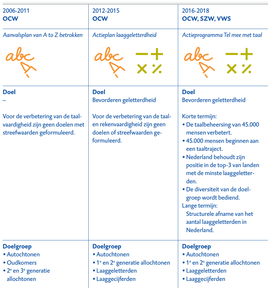
Figuur 2 Overzicht doelen en doelgroepen uit beleidsplannen 2006-2018 Bronnen: OCW, 2005; OCW 2011a; OCW, SZW&VWS, 2015

De cursussen die worden ondersteund door de methode Taal voor het Leven, ontwikkeld door de Stichting Lezen & Schrijven (zie onderstaand tekstkader), vinden plaats binnen het non-formele en informele onderwijs.