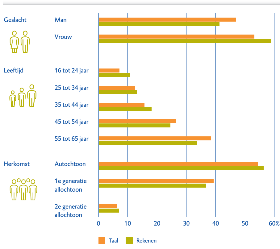
Figuur 3 Kenmerken van laaggeletterden en laagcijferden (peiljaar 2012)