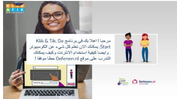
Klik & Tik. De start in Arabisch, Tigrinya, Engels