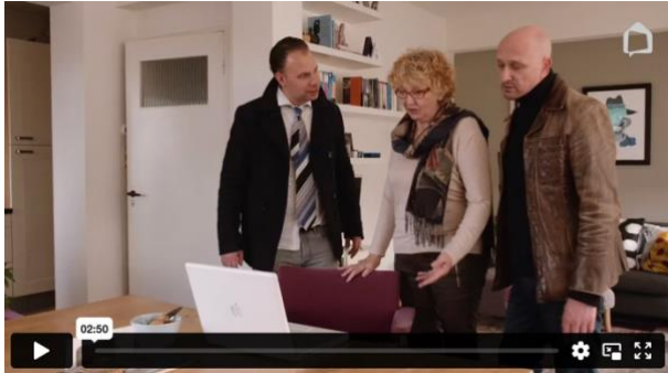
Bij werkblad 1 Aan- en verkoopfraude